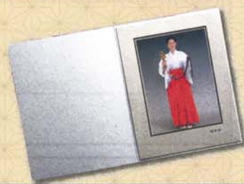
写真1枚台紙付き (6っ切 193x243mm)