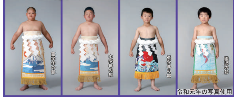
令和元年の写真使用